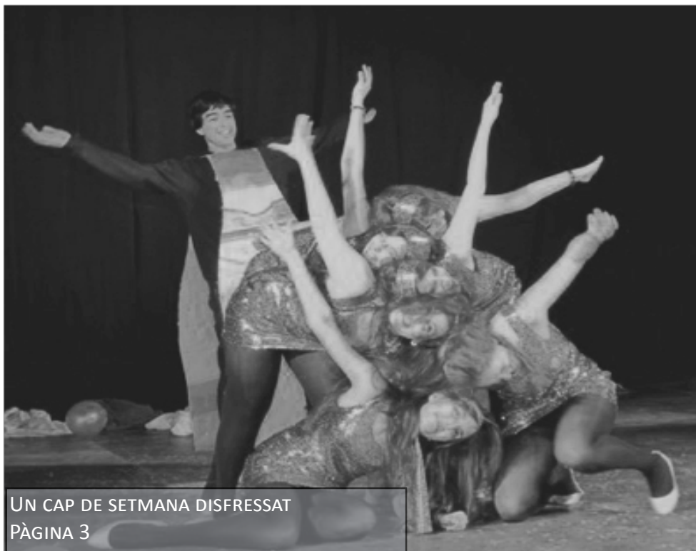
UN CAP DE SETMANA DISFRESSAT PÀGINA 3

Els redactors d'aquesta revista som un grup d'estudiants que volem difondre notícies i opinions sobre temes que ens interessin, tant de l'ambient més pròxim com del és internacional. Per això creiem que aquesta revista és el mitjà més adequat per donar a conèixer els fets locals a l'institut i informar els estudiants, ja que aquest és "un diari fet per estudiants i per a estudiants". Per això us convidem, lectors/es, a participar en la confecció d'aquesta revista tot aportant-hi articles on exposeu els vostres temes i opinions.